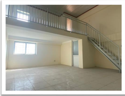
Hình ảnh căn hộ